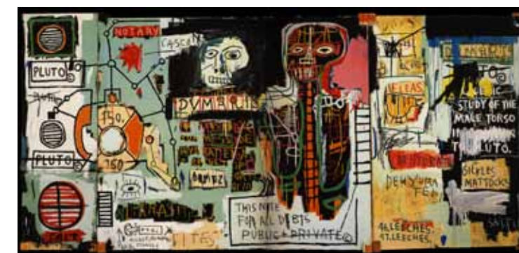
Jean Michel Basquiat